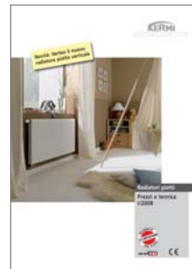
Radiatori piatti Prezzi e tecnica I/2008

Kermi offre una tecnologia del calore all'avanguardia con un programma di radiatori completo in grado di rispondere ad ogni tipo di esigenza. Per maggiori informazioni, visitare il sito Internet.